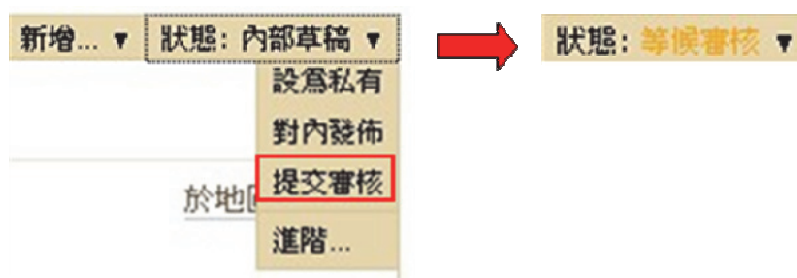
圖 2 提交審核