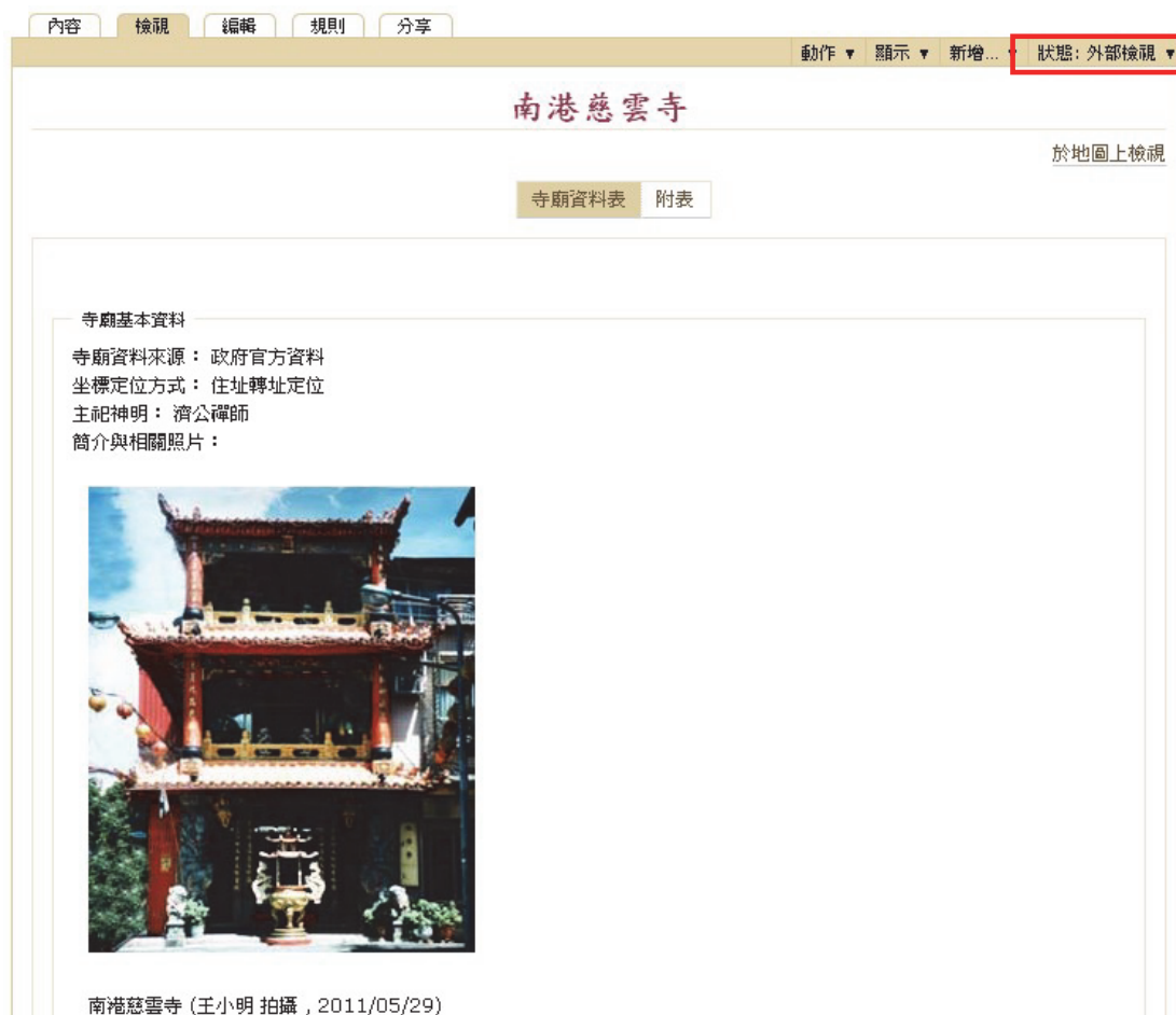
圖 4 審核通過

From: 文化資源地理資訊系統管理團隊 [mailto: roger@gate.sinica.edu.tw ] Sent: Tuesday, May 29, 2012 3:46 PM To: roger@gate.sinica.edu.tw Subject: 審核結果通知