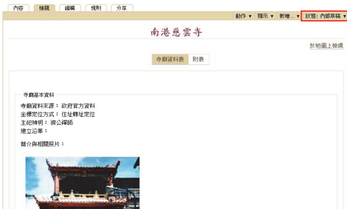
圖 13 變回內部草稿