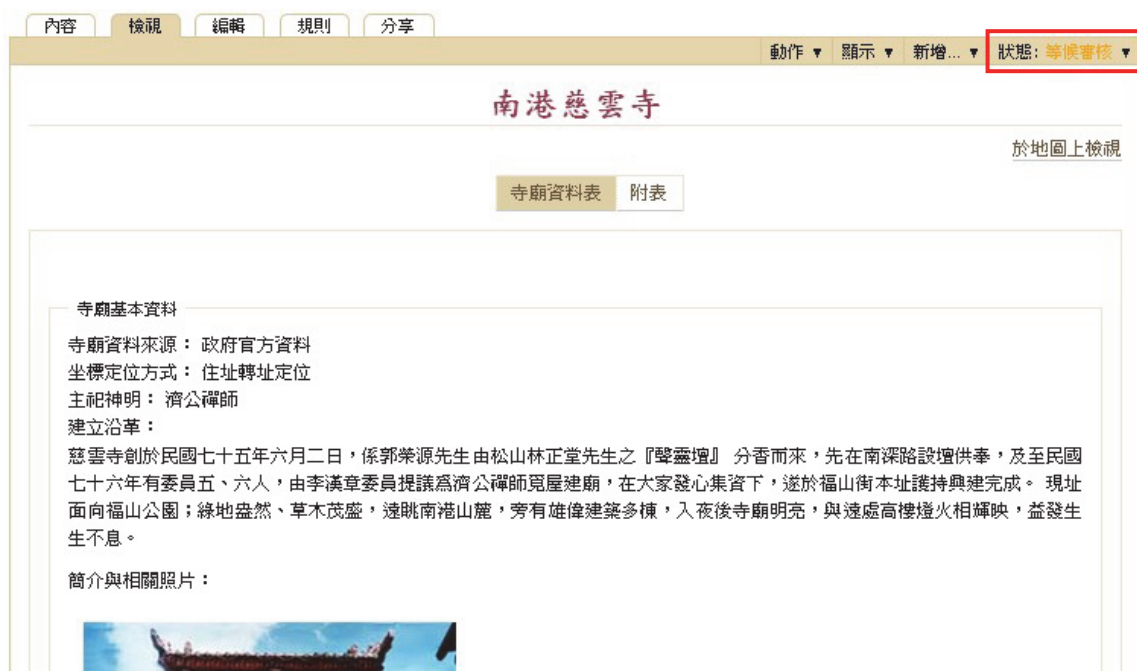
圖 11 重新等候審核